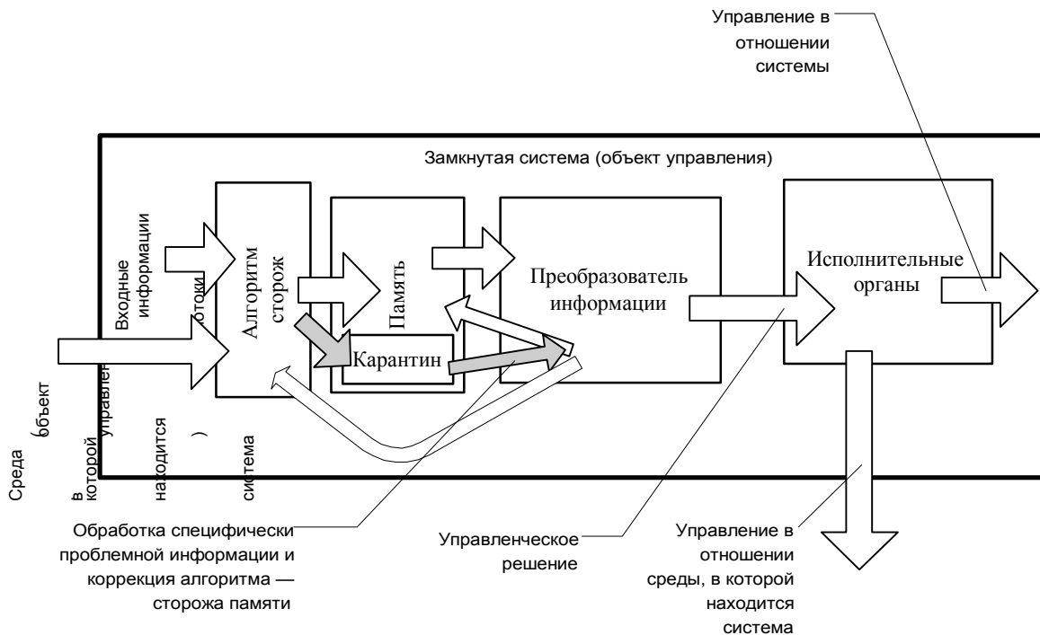
Схема 3. Чувства → алгоритм-сторож → память с «карантином» → интеллект с алгоритмом-реvisorом → действия

Третий способ представлен на схеме 3 ниже.