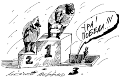
Рисунок Алексея Меринова 1

аплодисментами. «Власть разлагает молодёжь 2 — одну натравливает на другую. Это что за подготовка? К чему? У нас нет ни МВД, ни ФСБ — у нас есть мы сами у себя. Только на чувство собственного достоинства и на интеллект 3 надо опираться в этих условиях. Люди, я к вам, лидеры партий, обращаюсь: объединяйтесь! Переходите от слов к делу...»