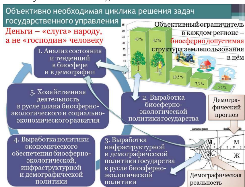
Рис. 2. ВЗАИМНАЯ ОБУСЛОВЛЕННОСТЬ ЧАСТНЫХ УПРАВЛЕНЧЕСКИХ ЗАДАЧ В ХОДЕ ОБЩЕСТВЕННОГО РАЗВИТИЯ.