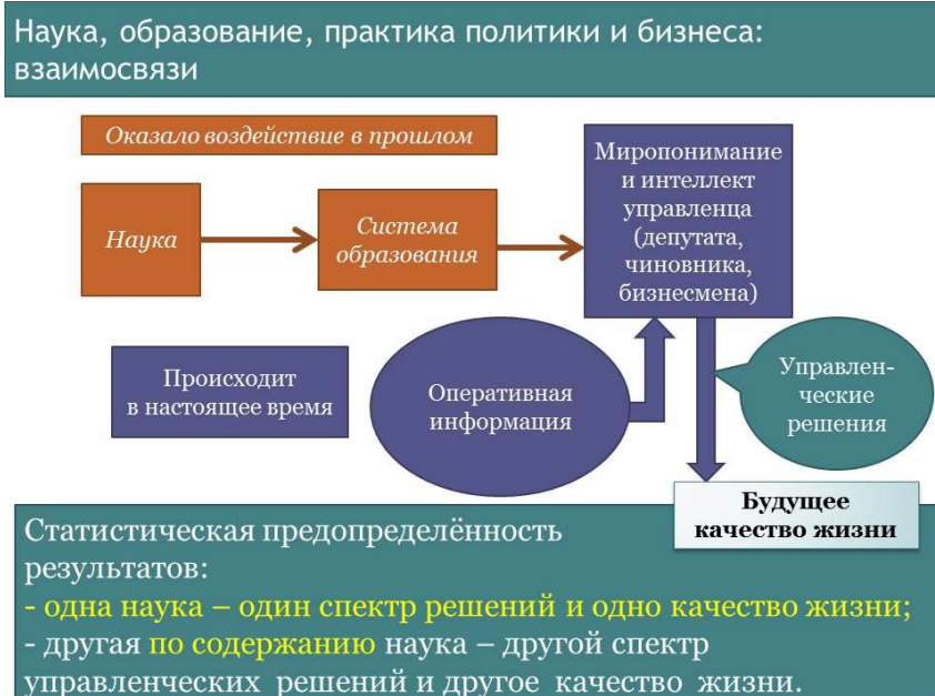
Рис. 1. ОБУСЛОВЛЕННОСТЬ СПЕКТРА УПРАВЛЕНЧЕСКИХ РЕШЕНИЙ И БУДУЩЕГО КАЧЕСТВА ЖИЗНИ НАУКОЙ И СИСТЕМОЙ ОБРАЗОВАНИЯ.

Государственное управление как и всякое управление требует информационно-алгоритмического обеспечения процесса управления. Информационно-алгоритмическое обеспечение — следствие научных теорий, т.е. следствие научно-методологического обеспечения государственного управления. Поэтому пределы возможностей определяются, в первую очередь, содержанием гуманитарно-обществоведческих научных теорий, на основе которых: 1) сформировались миропонимание, этические нормы и личностная культура чувств и мышления работников государственного аппарата, и 2) построено законодательство, правоприменительная практика и неcodифицированные составляющие деловой этики и практики государственного управления. Т.е. качество жизни общества в будущем формируется на долгосрочных интервалах времени в соответствии с закономерностью, представленной ниже на рис. 1. И за этим рисунком надо научиться видеть многоаспектный социальный процесс, включающий в себя: