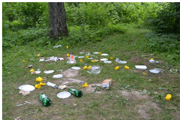
Рис. 2. «Менталитет» стадно-стайных обезьян как повсеместный генератор глобального экологического кризиса.

Следующие попытки её разрешения со стороны заправил и хозяев библейского проекта включают в себя два потока действий: